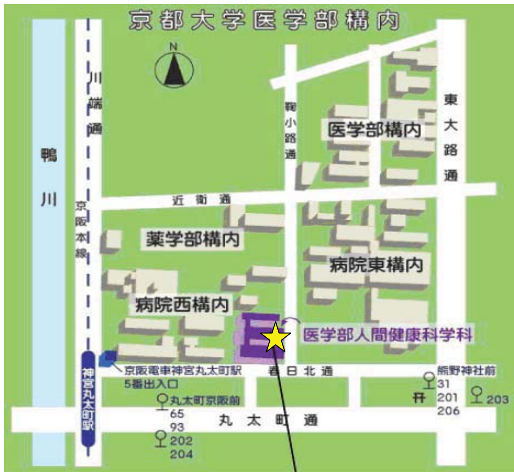
杉浦地域医療研究センター