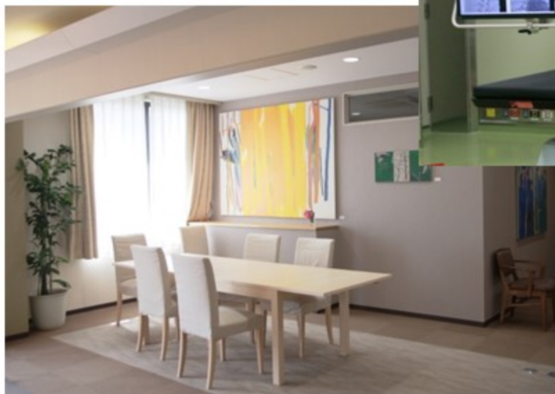
緩和ケア病棟 談話室