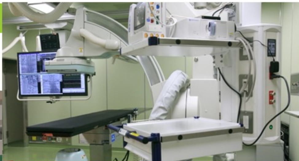
ハイブリッド手術室